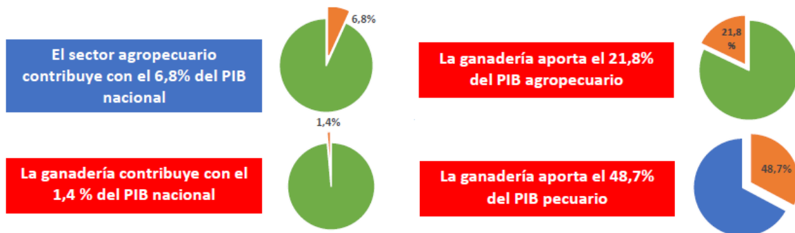
Grafica 2. Importancia económica de la ganadería

En el contexto nacional, según la FEDEGAN en su “ Hoja de Ruta Ganadería Colombiana 2018 – 2022 ” (2018), reporta que la ganadería bovina es la actividad económica con mayor presencia en el campo colombiano, puesto que se encuentra en todas las regiones, en todos los pisos térmicos y en todas las escalas de producción. Siendo la ganadería la principal actividad agropecuaria del país, aportando el 6,8% del producto interno bruto nacional.